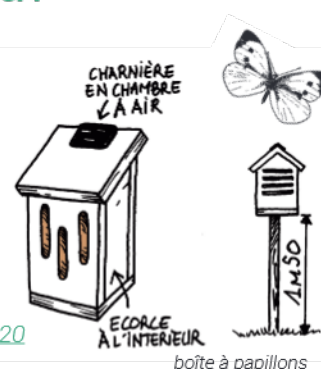
boîte à papillons

www.lpo.fr/la-lpo-en-actions/education-a-l-environnement/ressources-pedagogiques?Outil%20p%C3%A9dagogique=Tuto